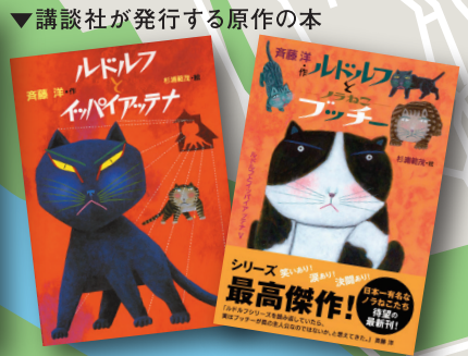
▲映画「ルドルフとイッパイアッテナ」のアニメ絵本（講談社発行）