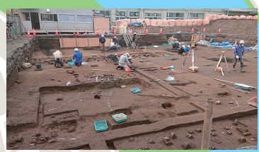
▲上小岩小学校の遺跡発掘調査